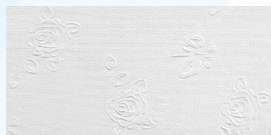
세이플러스 무형광 데코 3겹 점보롤