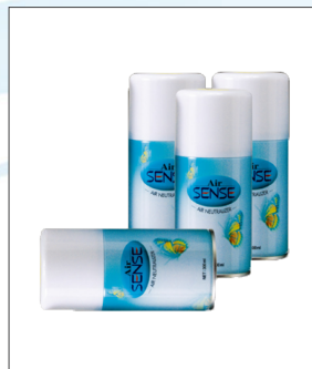
품명 보급형 캔방향제 포장단위 20개입