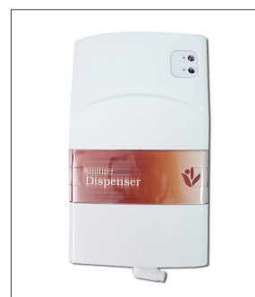
품명 자동 소변 세정기 포장단위 20개입