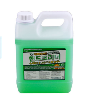
품명 물비누 포장단위 4L X 4개입