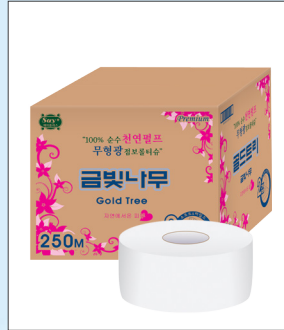
금빛나무 (골드트리) 천연펄프 2겹 점보롤