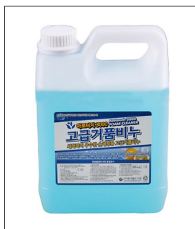
품명 거품비누 포장단위 4L X 4개입