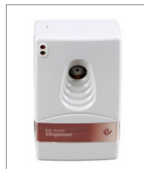
품명 액체향 자동분사기 포장단위 20개입