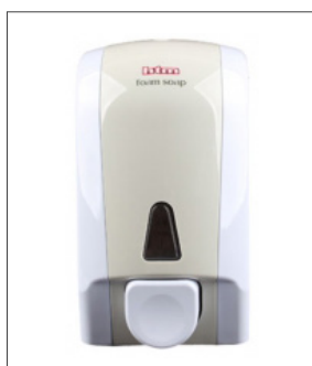
품명 거품비누 디스펜서 포장단위 20개입