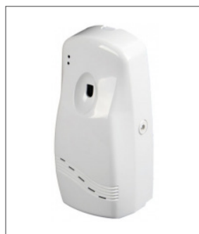
품명 방향제 자동분사기 포장단위 20개입