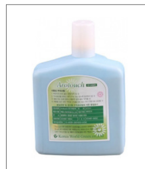
품명 자동 소변기 세정액 포장단위 10개입