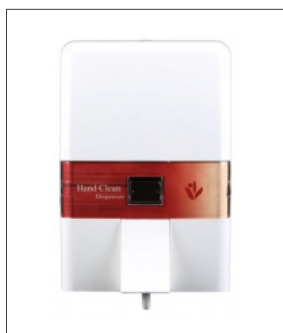
품명 물비누 디스펜서 포장단위 20개입