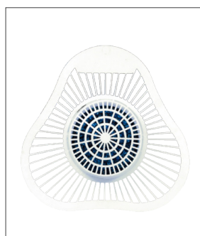
품명 소변기 세척 불럭 포장단위 50개입