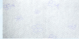
세이플러스 데코 2겹 점보롤