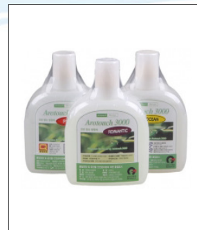
품명 천연 액체 방향제 포장단위 10개입