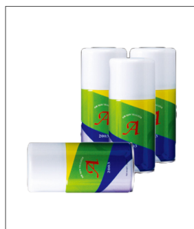
품명 고급형 캔방향제 포장단위 12개입