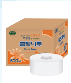
금빛나무 (골드트리) 천연펄프 1겹 점보롤